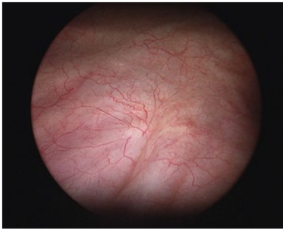
Cisztoszkópia során látott normális húghólyag

A vizsgálat után a húgyúti fertőzés kialakulásának kockázata alacsony. Fogyasszon sok folyadékot (24 óra alatt egyenletesen elosztva kb. 3 litert)! Kezelőorvosa antibiotikum kúrát javasolhat a fertőzés megelőzése érdekében. Amennyiben húgyúti infekció tüneteit észleli (fájdalmas vizeletürítés, láz, bűzös, zavaros vizelet), jelentkezzen kezelőorvosánál!