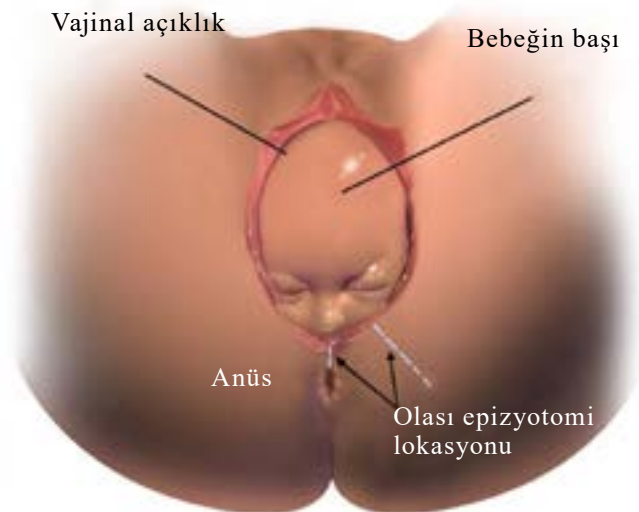
Şekil 3 - Epizyotomi