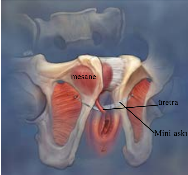
Şekil 4: Mini-askı

En yaygın uygulanan retropubik operasyon TVT (Gergisiz vajinal askı) sistemidir. Bu uzun süredir yapılan bir operasyondur, ve araştırmalar eğer operasyon sonrası başarı yakalanmışsa en az 17 yıl düzgün çalıştığını göstermiştir. Diğer retropubik ve transobturator yöntemler benzer başarı oranları sergilemektedir.