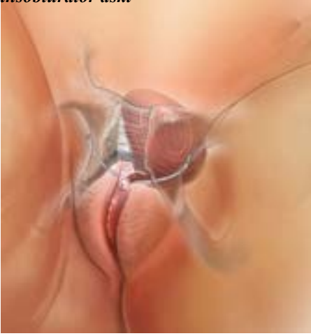
Şekil 3. Transobturator askı

rahi gereksinimi olduğunu göstermiştir. Kadınların %80-90'i geçirdikleri cerrahiden mutlu olduklarını, ve idrar kaçırma şikayetlerinin tamamen geçtiğini veya daha iyi olduğunu belirtmiştir. Bununla birlikte küçük bir grup hasta için operasyon işe yaramamaktadır. Eğer daha önce mesane ile ilgili (bir tamir ameliyatı gibi) bir ameliyat geçirmişseniz başarı şansı düşmektedir.