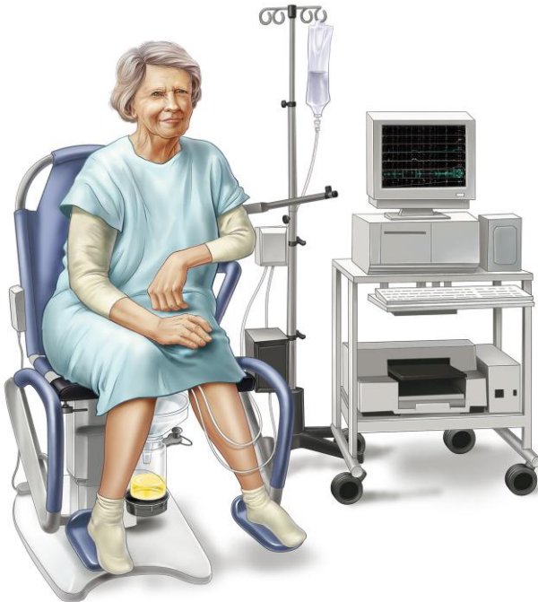
Figure 2. Bilan urodynamique

minutes ; il n'est pas nécessaire d'être à jeun ou de suivre un régime. Une anesthésie n'est pas nécessaire. Le jour de l'examen, portez une jupe ou un pantalon car il vous sera demandé d'enlever « le bas ».